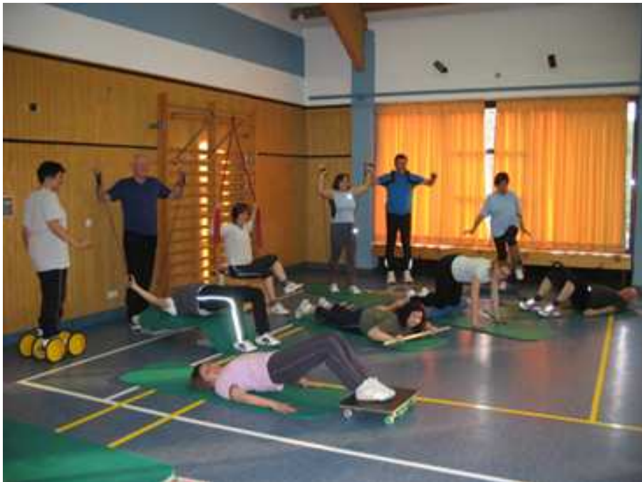
Aus unseren Kursen: Zirkeltraining in der Bürgerhalle

Steigerts Steinreihe 14 Tel. 06257-85793 mail: SabSchwab@aol.com